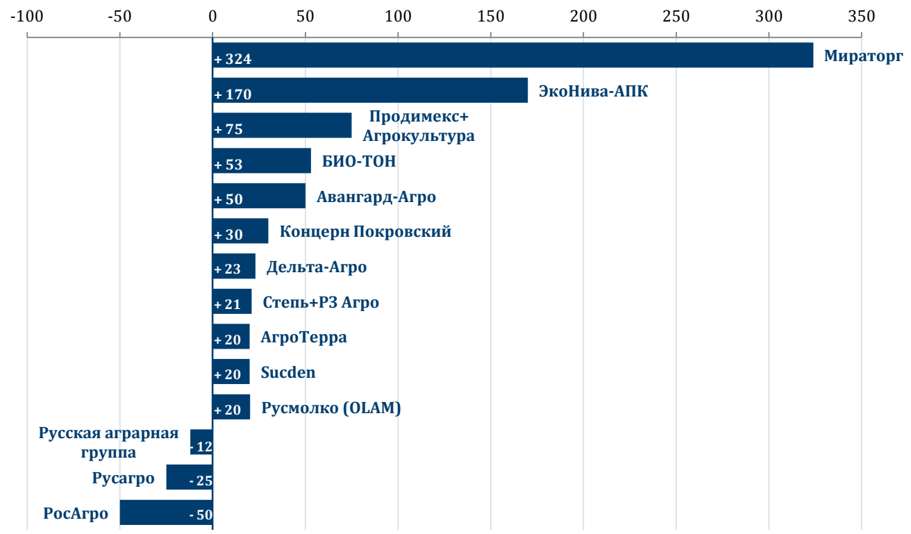
Рисунок 3. Лидеры по изменению земельного банка под контролем с мая 2018 года по май 2019 года, тыс. га

Что касается позиции в рейтинге, среди компаний, поднявшихся на несколько строчек вверх: Краснояржская зерновая компания (за счет прибавления земель молочного комбината «Авида», см.Примечания), Сибирский деловой союз, БИО-ТОН, Русмолко (OLAM); а вниз на наибольшее количество строк опустилась Русская аграрная группа (см.таблицу справа).