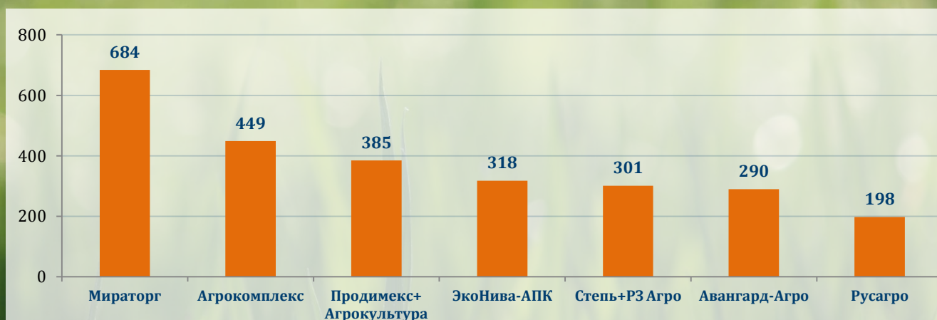
Рисунок 2. Наибольший прирост земельного банка под контролем текущих лидеров рейтинга с 2012 по 2019 гг., тыс. га

совместно с РЗ Агро еще не побывали в пятерке лидеров, но неизменно присутствуют в первой десятке.